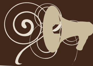
TABLE DE CONCERTATION DES FORUMS JEUNESSE RÉGIONAUX DU QUÉBEC

Cette année encore, le FJAT a continué de participer aux activités régulières de la TCFJRQ. En plus d'œuvrer sur divers comités de travail, le FJAT participe aux rencontres nationales, qui sont autant d'occasions pour les forums jeunesse régionaux du Québec de partager et de développer leur expertise. Concrètement, la Table a pour mission : d'offrir à ses membres un lieu de concertation, de partage d'expertise, de transfert d'information et de formation ; de promouvoir les forums jeunesse, leurs actions, leurs intérêts et préoccupations communes, ainsi que leurs orientations collectives en matière de jeunesse et de développement régional; de représenter les actions, les intérêts et préoccupations communes des forums jeunesse ainsi que leurs orientations collectives en matière de jeunesse et de développement régional.